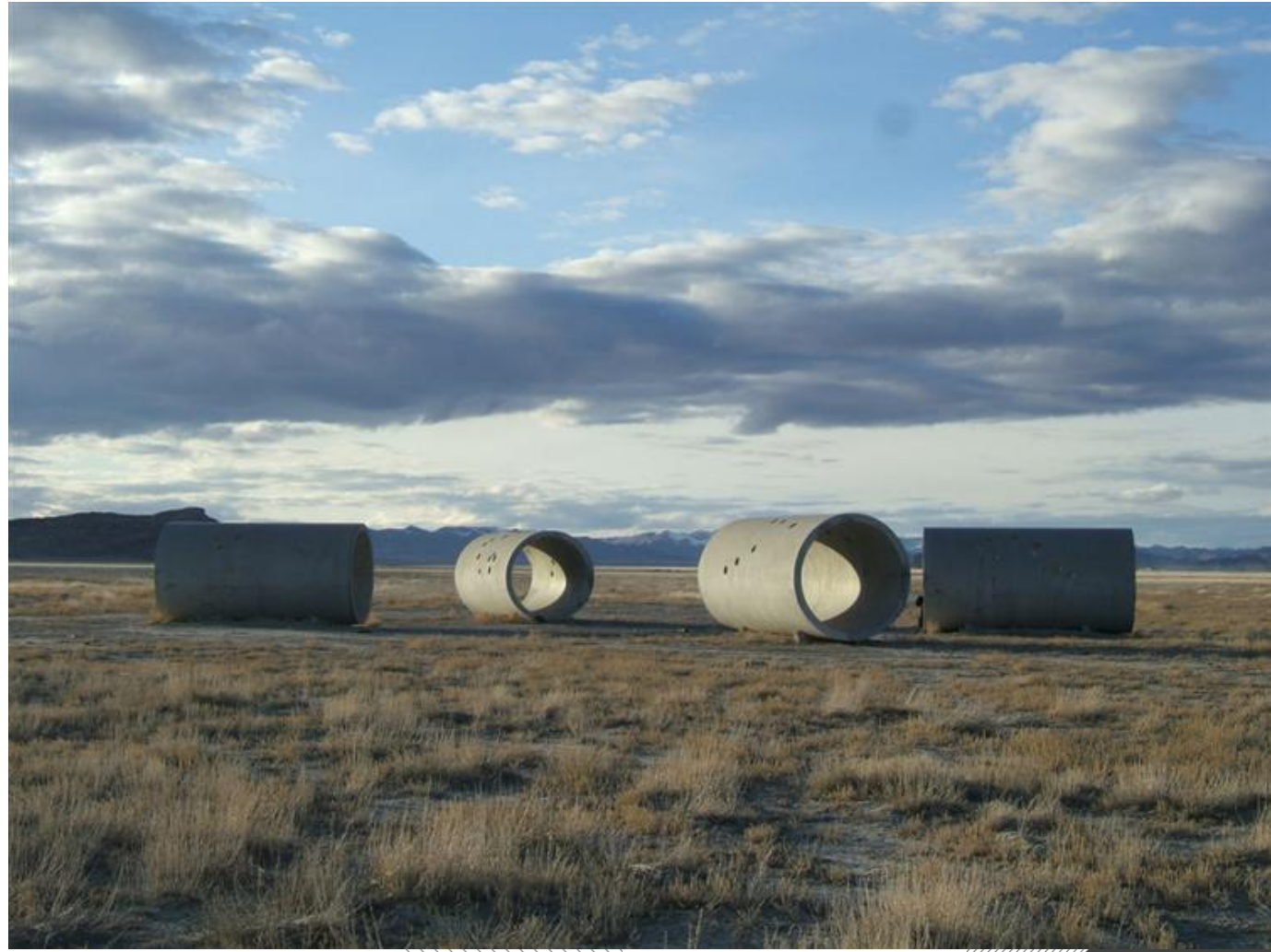
Sun Tunnels, 1973-76, Great Basin Desert, Utah, US © Holt/Smithson Foundation and Dia Art Foundation