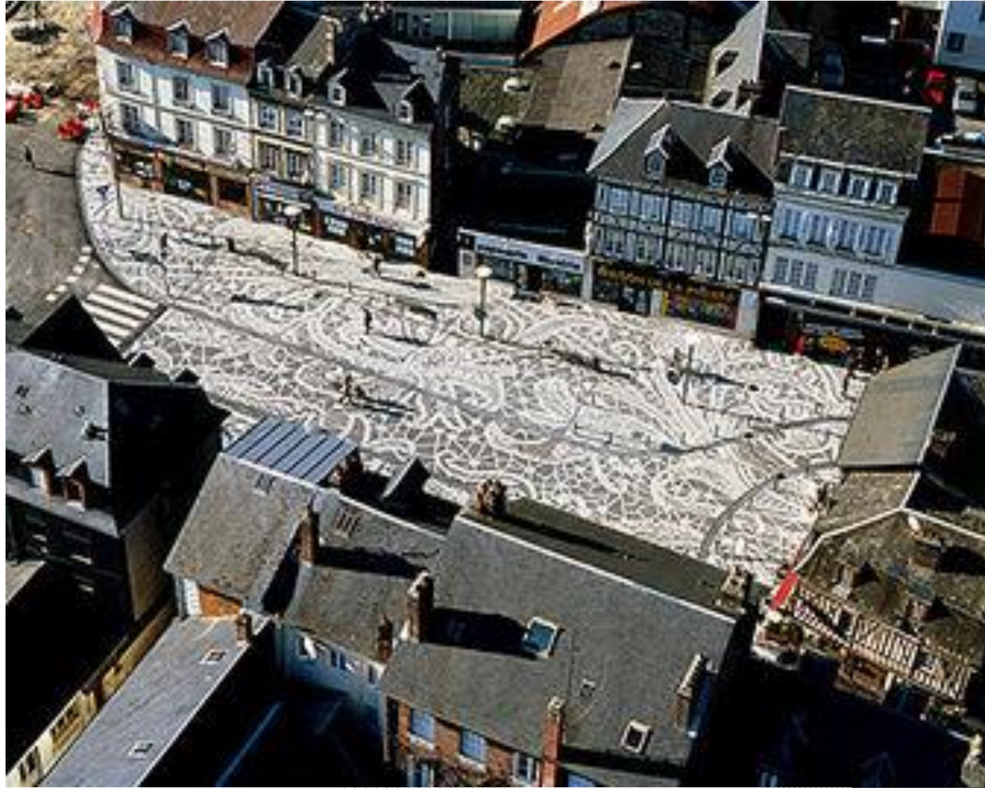
Cha-Cha-Cha , 2000-01 Sol pavé granit blanc et basalte noir sur 3000 m 2 . Carrefour du Pot d'étain, Pont-Audemer © E. Ballet