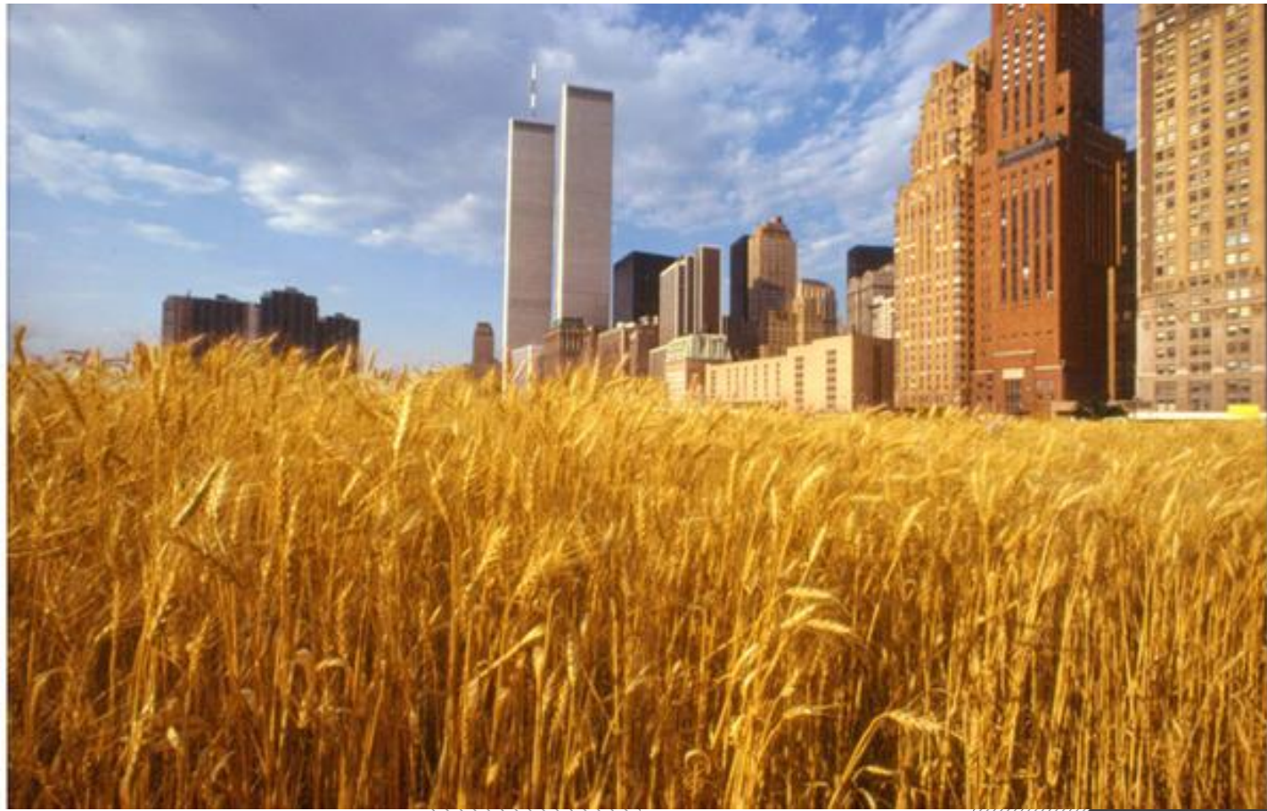
Wheatfield - A Confrontation: Battery Park Landfill, Downtown Manhattan, 1982