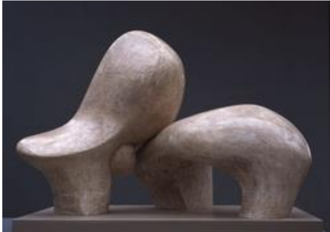
Henry Moore, Working Model for Sheep Piece [Maquette de travail pour pièce de mouton], 1971. Plâtre - 116 x 152,5 x 105 cm. LH 626.