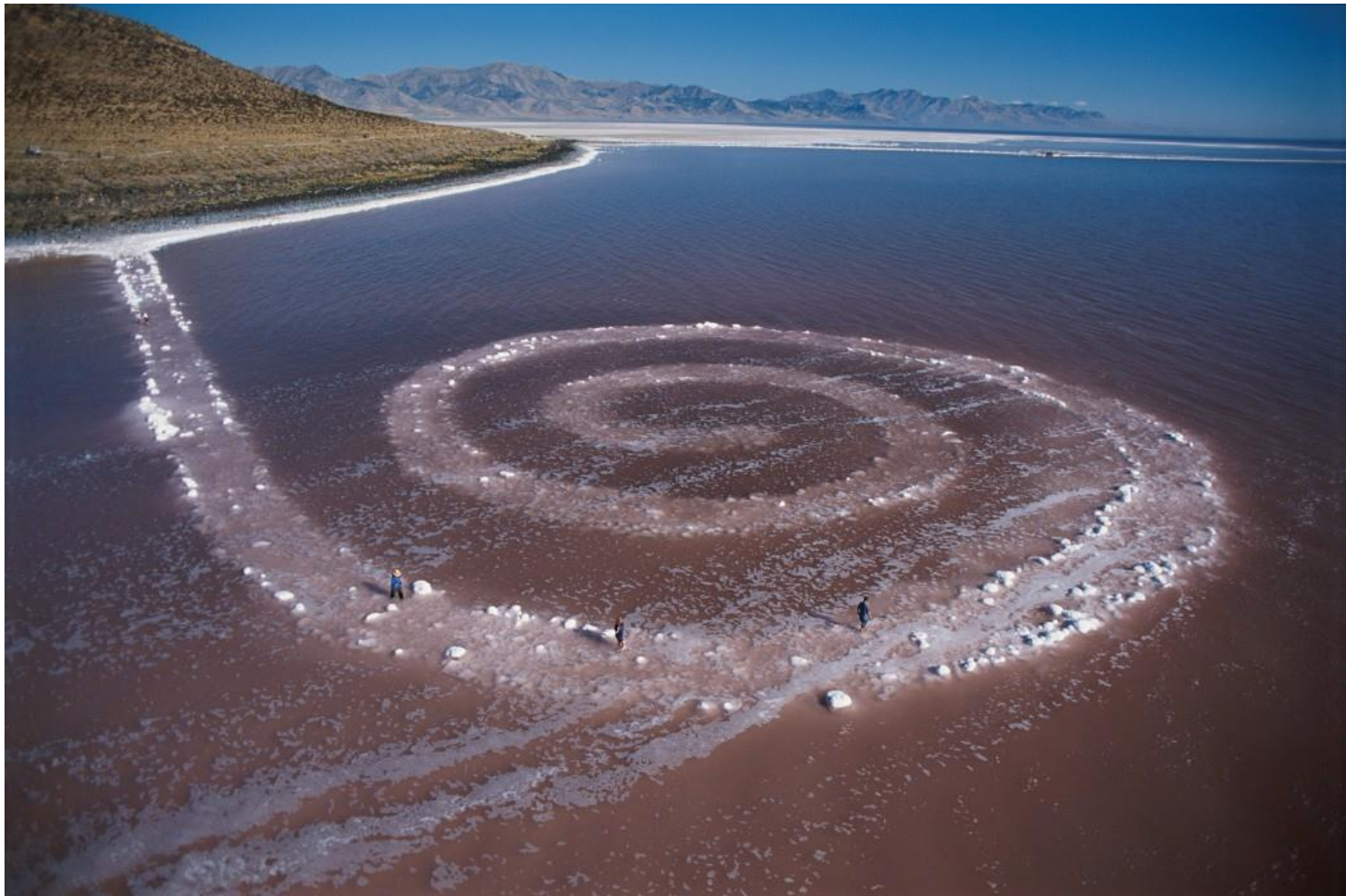
Spiral Jetty , 1970. © Holt/Smithson Foundation and Dia Art Photo: George Steinmetz