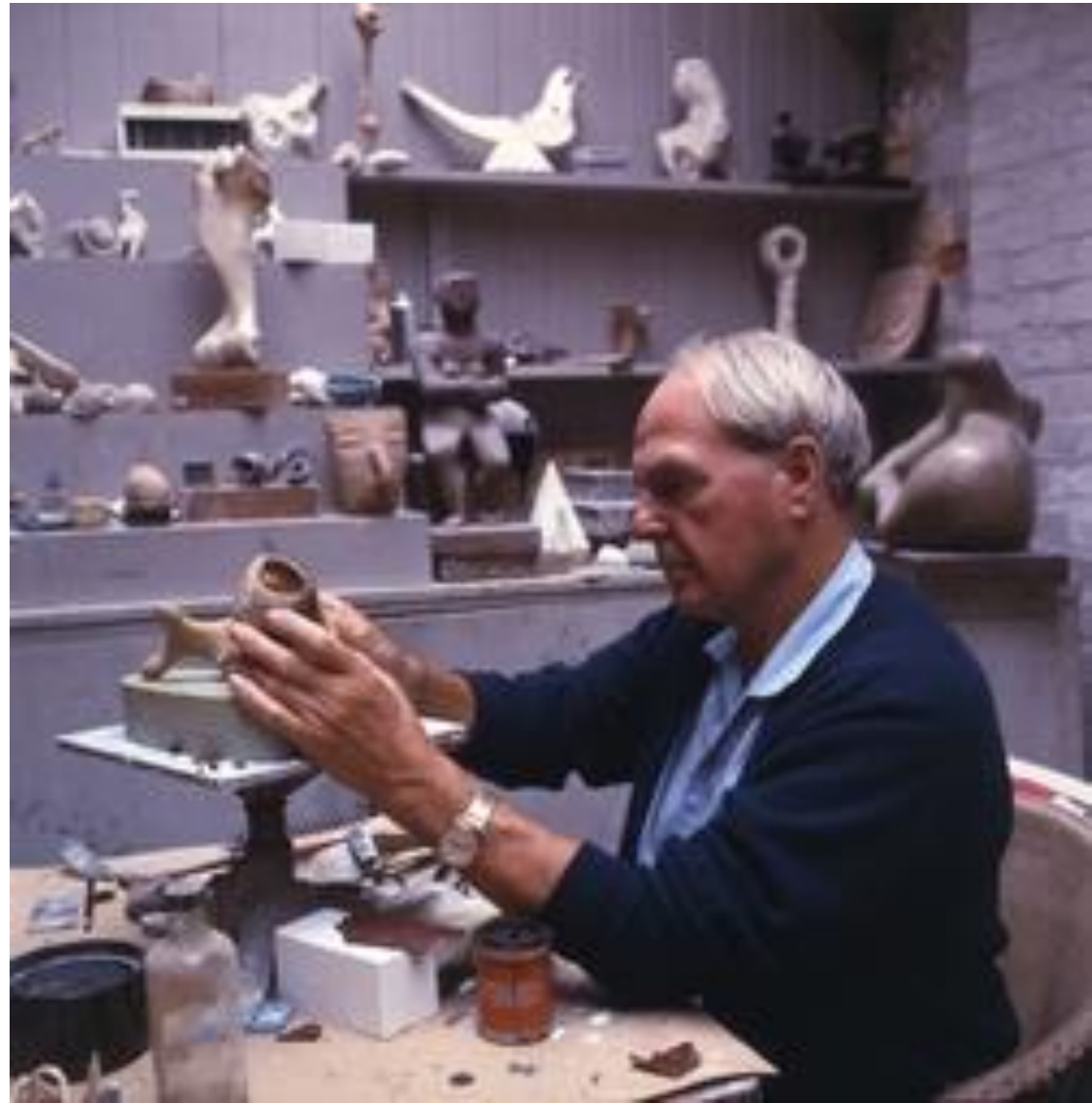
Henry Moore dans l'atelier d'origine : Maquette studio au début des années soixante.