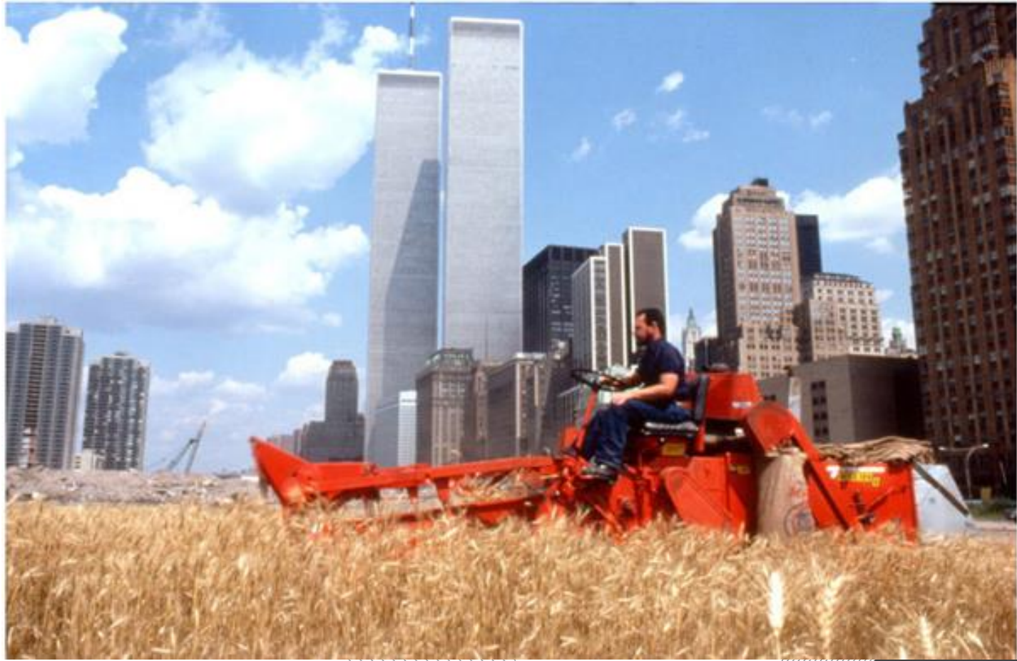
Wheatfield - A Confrontation: Battery Park Landfill, Downtown Manhattan, 1982