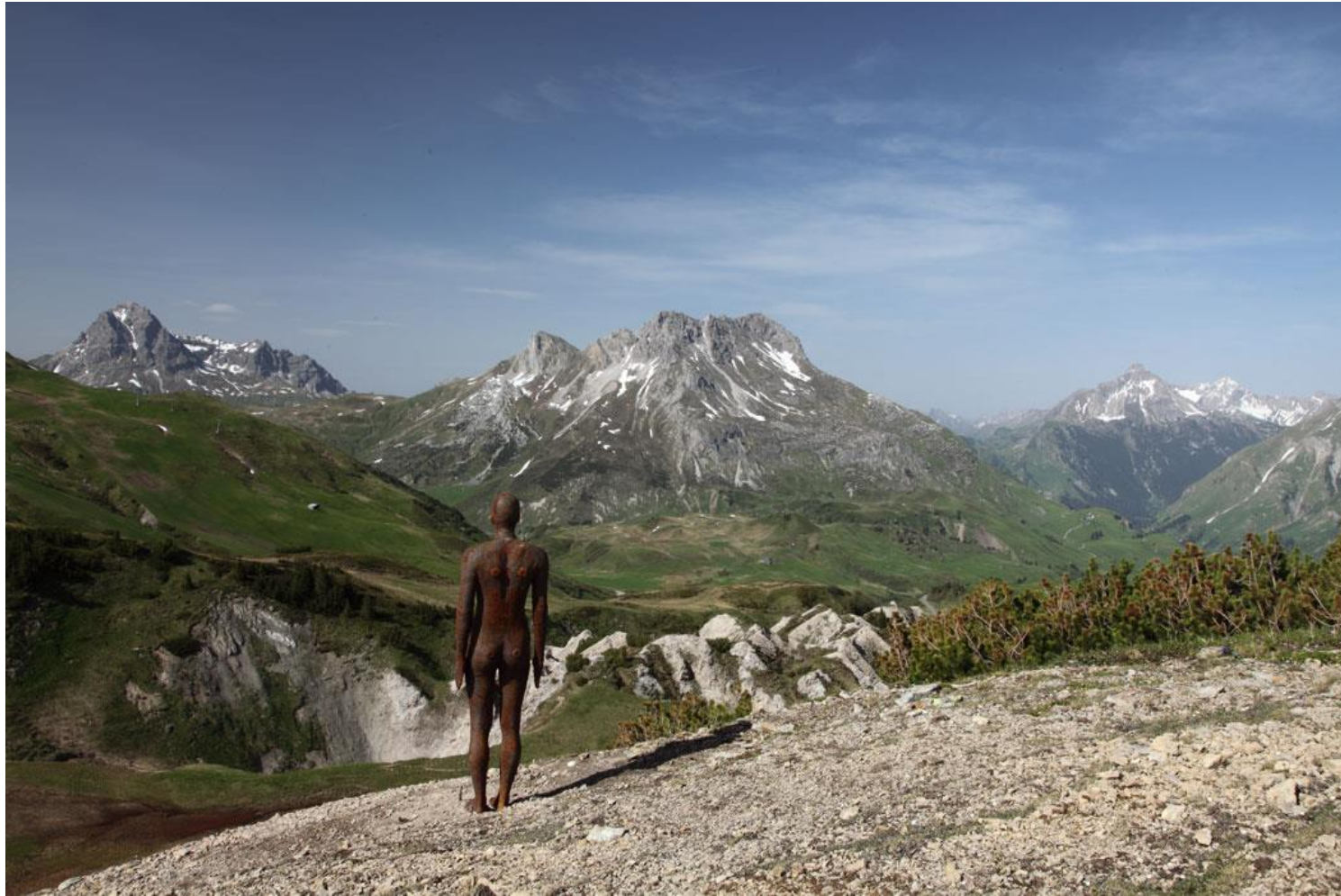
Horizon Field , 2010 Installation à l'échelle du paysage dans les Hautes- Alpes de Vorarlberg, Autriche. 100 figures à taille humaine en fonte réparties sur une surface de 150 km 2 . © Kunsthaus Bregenz et l'artiste Photo : Markus Tretter