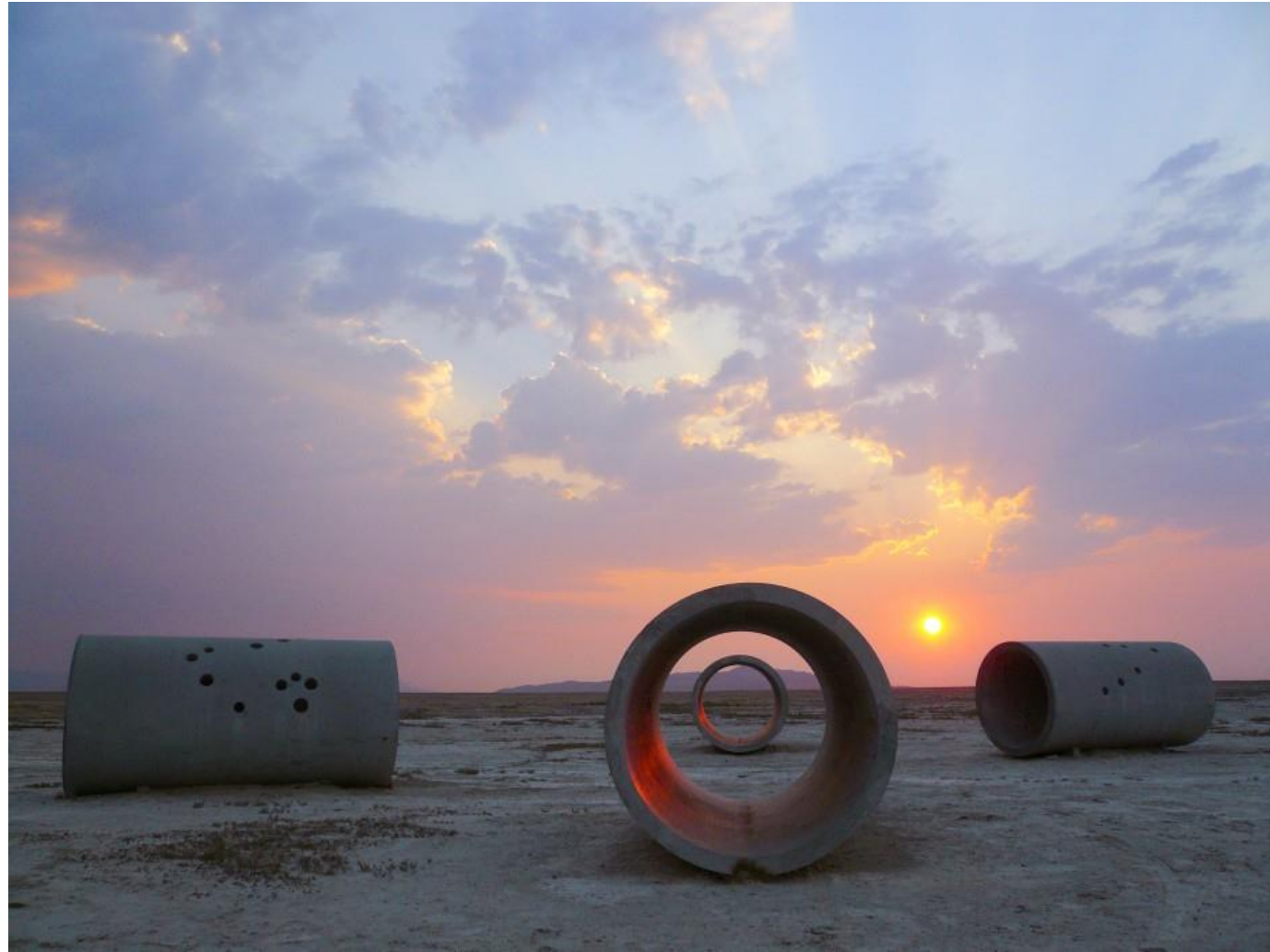
Sun Tunnels, 1973-76, Great Basin Desert, Utah, US © Holt/Smithson Foundation and Dia Art Foundatio