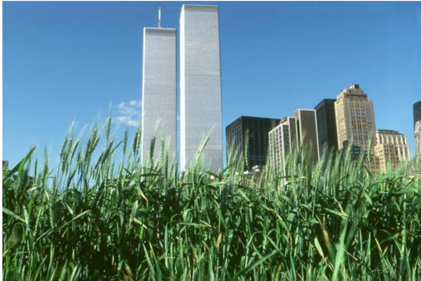
Wheatfield - A Confrontation: Battery Park Landfill, Downtown Manhattan, 1982