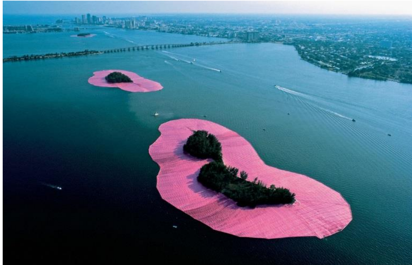
Christo and Jeanne-Claude Surrounded Islands, Biscayne Bay, Greater Miami, Florida, 1980-83