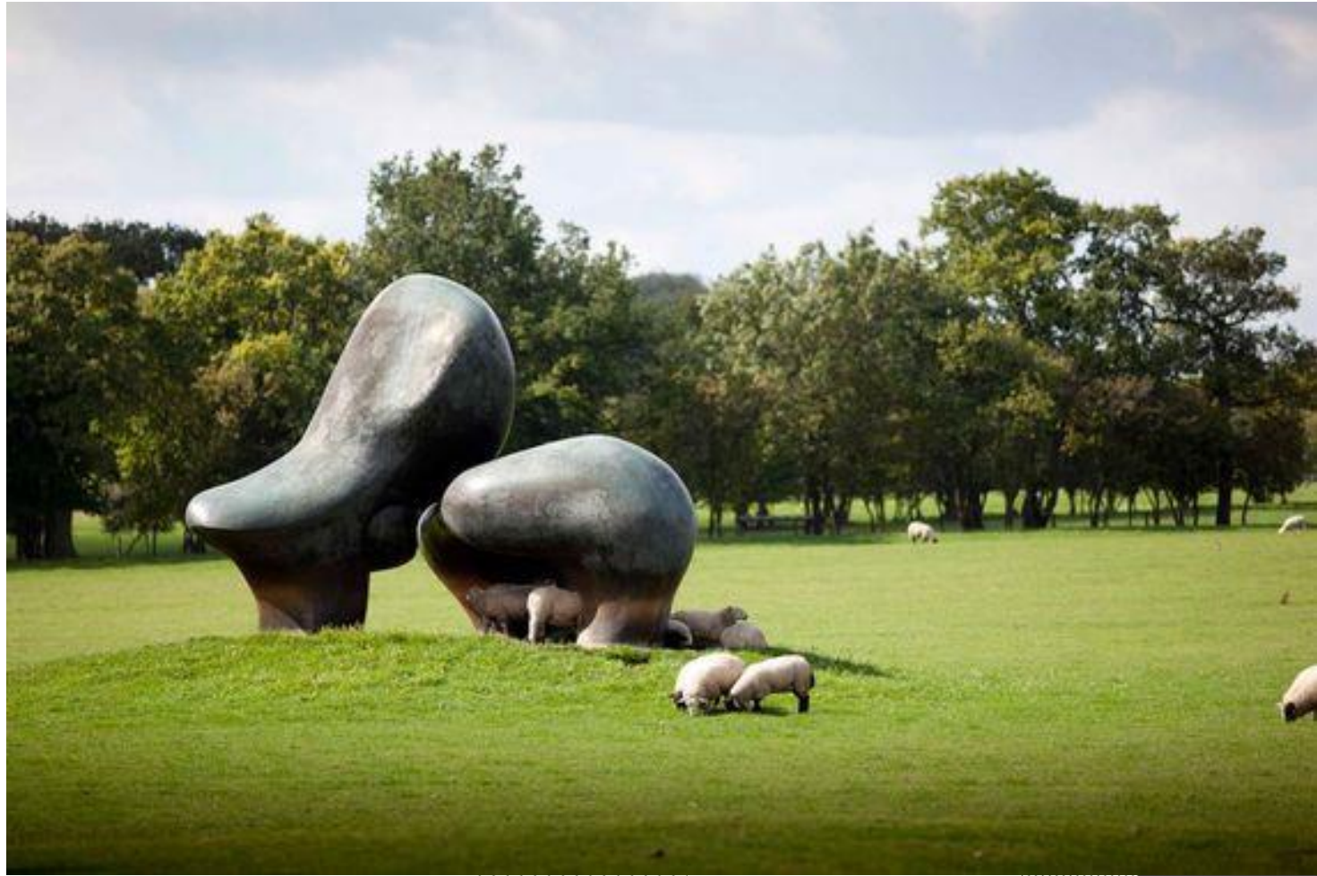
Sheep Piece Henry Moore Foundation, Perry Green, Hertfordshire, UK, 1971-72, bronze © Henry Moore Foundation. Photo : Jonty Wilde