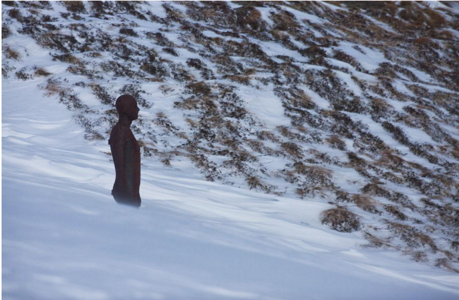
Horizon Field, 2010 Installation à l'échelle du paysage dans les Hautes- Alpes de Vorarlberg, Autriche. 100 figures à taille humaine en fonte réparties sur une surface de 150 km 2 . © Kunsthaus Bregenz et l'artiste Photo : Markus Tretter