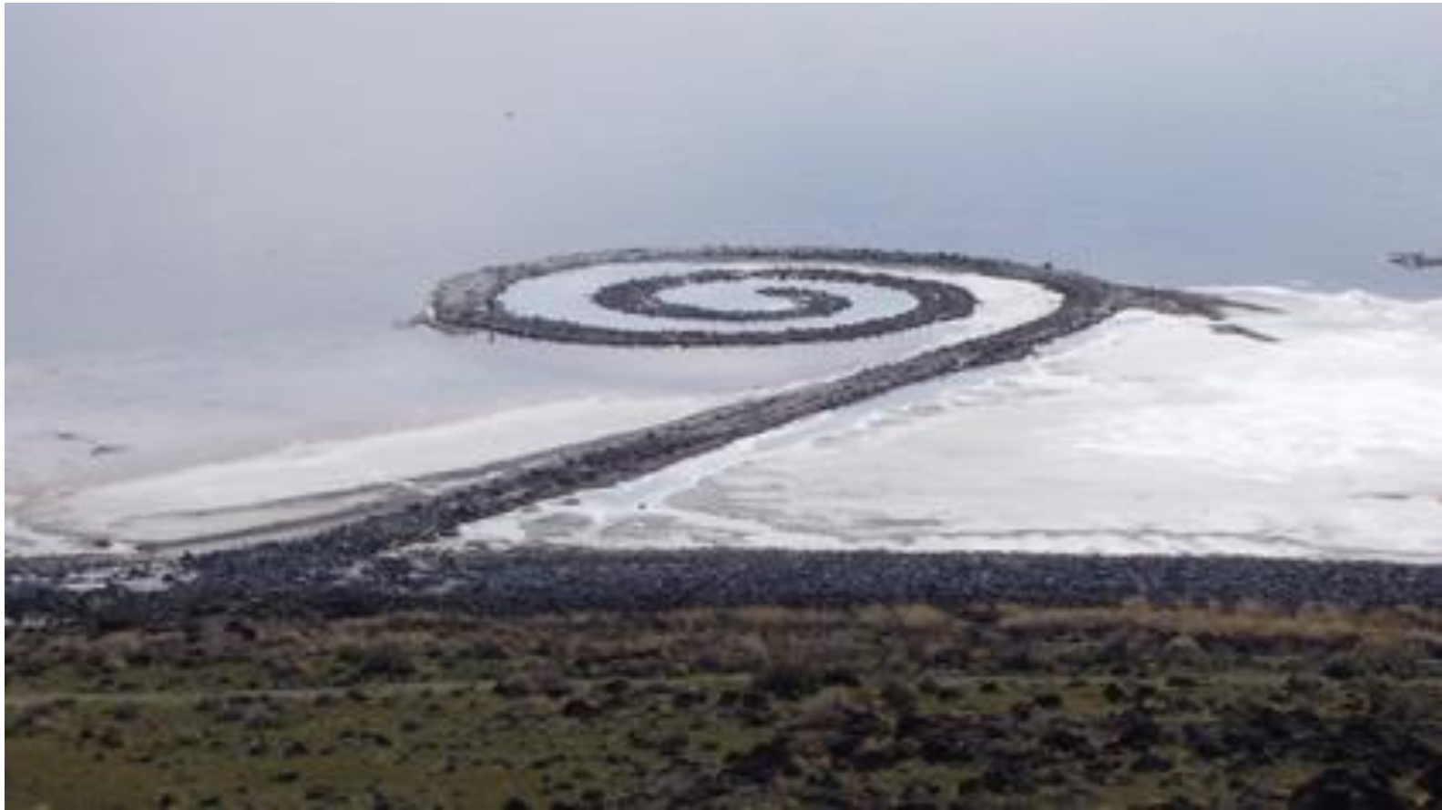
Spiral Jetty vue depuis Rozel Point, avril 2005